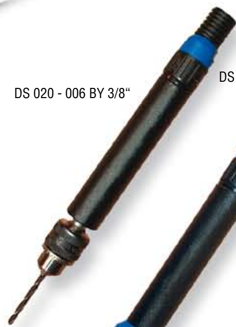
DS 020 - 006 BY 3/8"