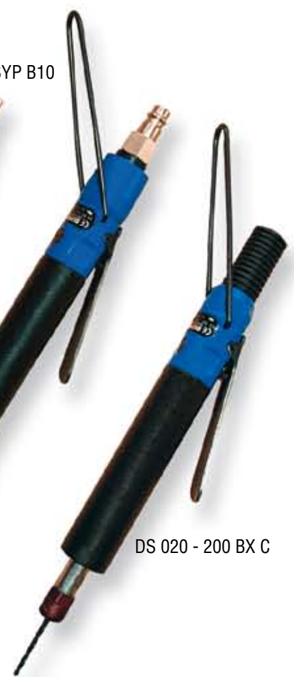
DS 020 - 200 BX C

Start: mit Hebelventil oder Drehventil Drehzahl: 600 - 20 000 min -1 Bohrer - Ø: bis max. 6,35 mm